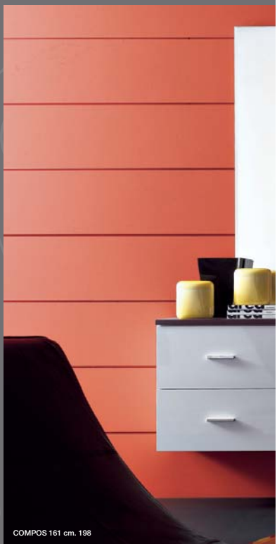
COMPOS 161 cm. 198

Gloss white acqu compo with w finish The made two drawer